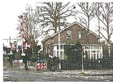
▲ Het stationschefhuis, dat moest wijken voor de ondertunneling van het spoor.